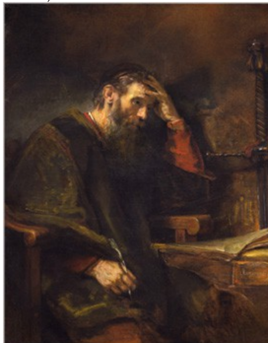
The Apostle Paul by Rembrandt van Rijn, 1657 (National Gallery of Art)

Paavali sanoo, että hänet "temmattiin kolmanteen taivaaseen". Paavali ei siis "kuollut" ja palannut sitten taas henkiin. Juutalaisuudessa kolmas taivas tarkoitti Jumalan asuinsijaa. Toinen taivas tarkoitti avaruutta, jossa planeetat ja aurinko ovat. Ensimmäinen taivas taas oli ilmakehäme, pilvien ja lintujen asuinpaikka. Paavali tarkentaa, että hänen mainitsemansa kolmas taivas oli "paratiisi" (kr. paradeisos).