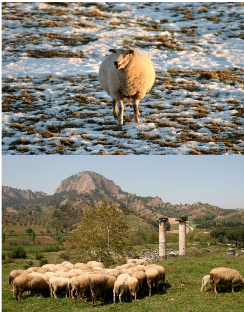
...kadonnut lammaslaua oli minun kansani...

Nehemia mainitsee juutalaiset 11 kertaa ja Israelin 22 kertaa. Ne, jotka jäivät Persian laajan valtakunnan 127 provinssiin, olivat