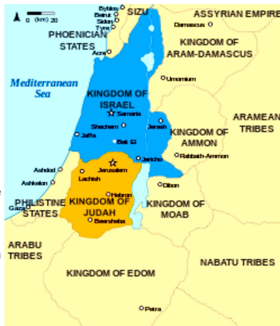
Israelin ja Juudan kuningaskunnat

koota sinut, Jaakob, kaikkinesi, visusti kerätä Israelin jäänteet, saattaa heidät yhteen, niinkuin lampaat tarhaan, niinkuin lauman laitumellensa: on oleva ihmisten kohina!" Tässä puhutaan koko "Jaakob/Israelin jäänteistä", jännöksestä, ei taaskaan sukukuntia erotellen vaan kaikki yhdessä.