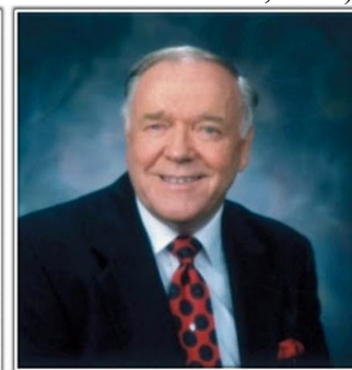
KENNETH E. HAGIN