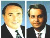
Morris Cerullo Benny Hinn