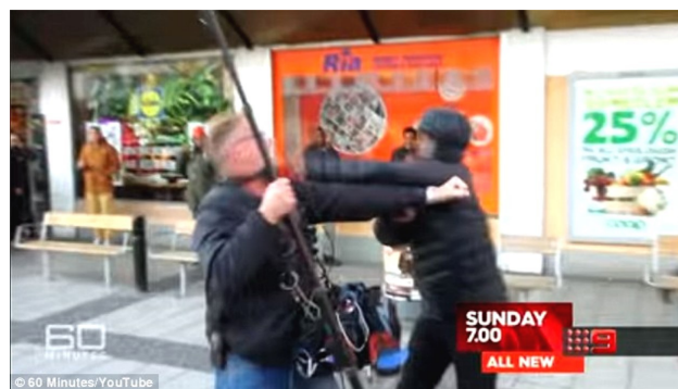
Australian 60-minutes ohjelman työntekijä hyökkääjän kohteena

Eri Euroopan maista ääri-islamilaisiin sotaisiin liikkeisiin liittyneet - pohjoismaat ”hyvin” edustettuina