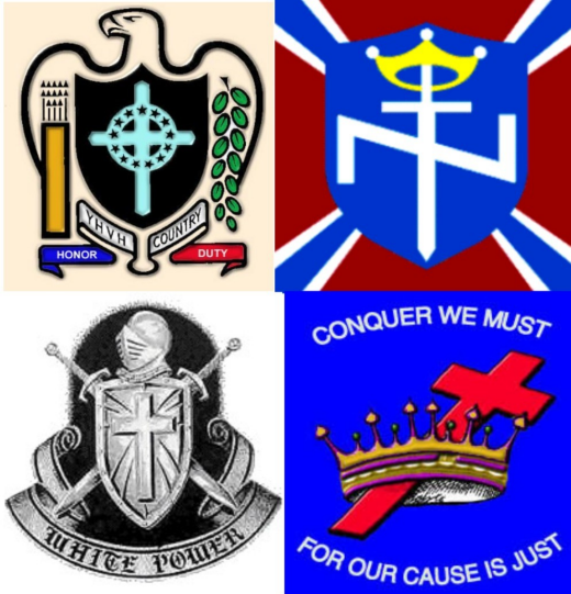
Christian Identity liikkeen tunnuksia

Yhdysvalloissa british-israelismi ajattelun yksi haara tunnetaan nimellä "The Christian Identity Movement" (Kristillinen identiteetti). Liikkeeseen kuuluu vanhoillisia kirkkoja ja ryhmiä. Jotkut ryhmät toimivat erillään muista, toiset muodostavat löyhiä verkostoja, mutta yhteistä monelle on antisemitismi. Christian Identity Movement -liikkeellä on ollut yhtymäkohtia myös Klu Klux Klan -liikkeeseen, jonka perusti pastori William Simmons vuonna 1915. Amerikassa on juutalaisia vihaava pieni äärimmäisyysliike, joka pohjaa natsismiin ja arjalaiseen rotuajatteluun. Tässäkin ryhmässä tulkitaan Raamattua ja "todellinen Israel" liitetään heidän yhteyteensä. Juutalaiset ovat pettureita, todelliset israelilaiset rotupuhtaita ja "raamatullisia" arjalaisen rodun edustajia.