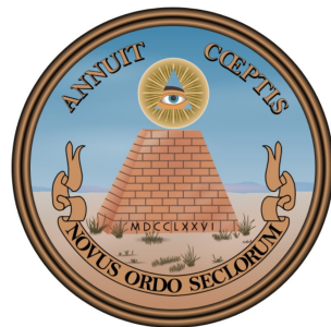
The Great Seal of the United States

todisti monelle kirjoittajalle Amerikan kuulumista Israelin raamatulliseen heimoon. Amerikka on Joosefin toisen pojan Manassen siunausten perijä. "Manassesta piti tulla suuri kansa... näen tämän lupauksen kirjaimellisen täyttymyksen Yhdysvalloissa." Monissa kirjoituksissa esiintyi suurta kiinnostusta Egyptin pyramideihin. Erityisesti Gizan pyramidilla katsottiin olevan suuri merkitys "pyramidi on valtava todistus Jumalasta ja hänen kansastaan" , kirjoitti Wild.