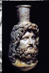
Zeus (vas.), Asklepius ja Sarapis (pikkukuva)

Pakanauskontojen filosofit olivat yleisesti pitkätukkaisia. Filosofit Epictetus eli n. 50 vuotta apostoli Paavalin ajan jälkeen. Hän painotti tosi filosofien olevan olemukseltaan pitkähiuksisia ja -partaisia. Ennen 300-lukua tavatuissa harvoissa kuvissa Jeesus on lyhythiuksinen, kuten Paavali viittaa juutalaisen miehen olleen. Kun Jumala antoi määräyksiä koskien Ilmestysmajassa palvelevaa papistoa Hän määräsi, "Älkää päästäkö tukkaanne hajalle", 3.Moos.10:6. Näin