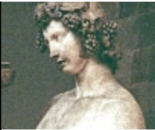
Mithras (vas.) ja Bacchus