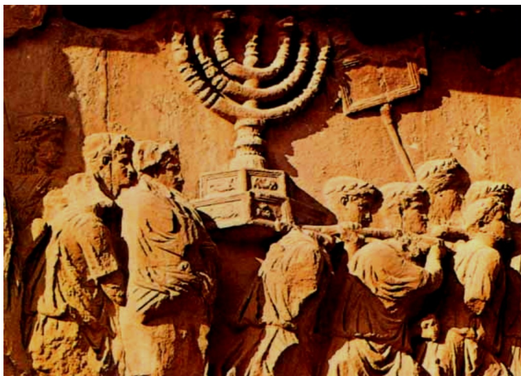
Tiituksen riemukaaren Roomassa on kuvattu juutalaisia sotavankeja: miehillä on lyhyet hiukset

kokoontumispaikoista) ja seinät (joissa kuvia) valkaistaan." (Epiphanius of Salamis: Letter to the Emperor Theodosius).