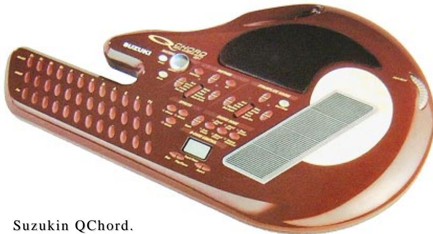
Suzukin QChord. Uusin malli.